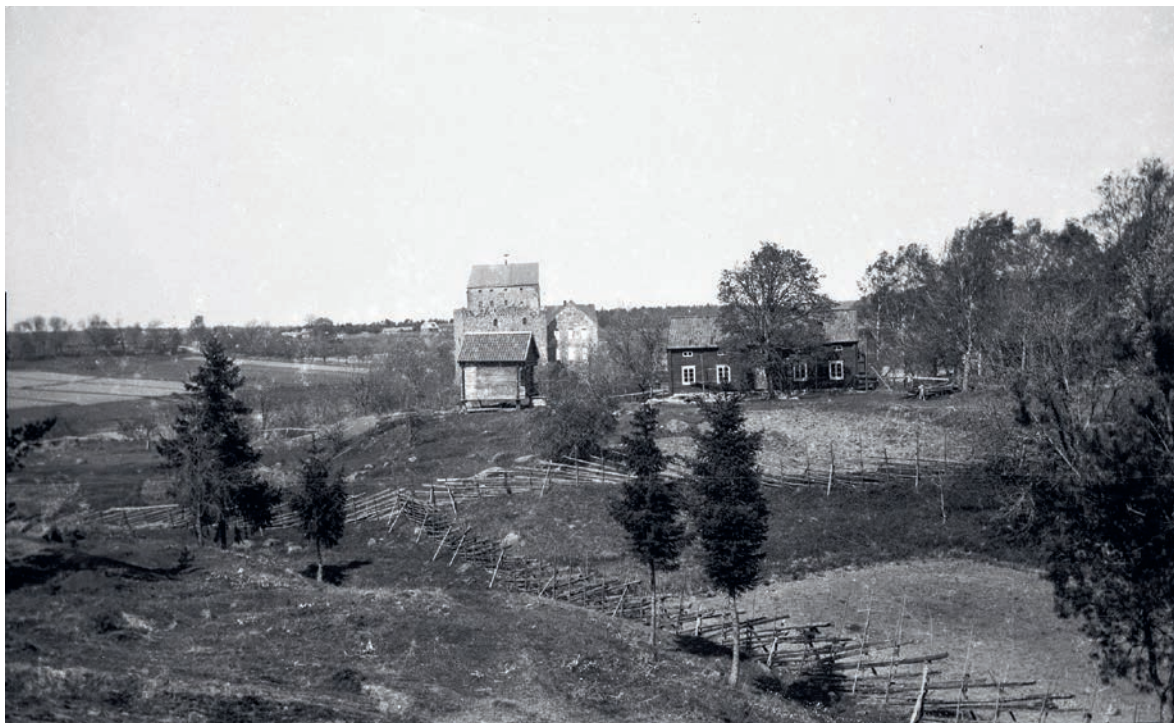
På fotografiet har mangårdsbyggnaden och stolphäbret flyttats till området för Jan Karlsgården. I bakgrunden syns Kastelholms slottsruiner.

takfoten, foderbräden runt fönster, knutpilastrar, portar med mera. Fenomenet kan förklaras med att det troligen funnits någon mer eller mindre kunnig inom socknen som har haft inflytande på byggandet. Även de olika öarnas tillgång på byggnadsmaterial har påverkat i viss grad. 18 Byns läge, ofta vackert placerad på ett backkrön, och bebyggelsens anpassning till landskapet och terrängen är kännetecknande för Åland. 19