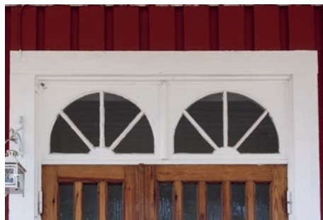
Kollage av detaljer signifikanta för Rudskogs byggnader. Låga fönster under långsidans takfot, lunettfönster i gavelspetsen, brett överstycke i fönstrets foder, dubbla lunettfönster i entrédörrens överstycke.

konstaterar att en vandring genom det åländska landskapet var som att vandra på den svenska landsbygden femtio år tidigare. Han beskriver intrycket av sina upplevelser som ”mer svenskt än i Sverige”. Han syftade då inte i första hand på bebyggelsen utan snarare på det sociala livet där köket fortfarande fungerade som äldre tiders storstuga, där familj inklusive drängar och pigor samlades och åt ur en gemensam skål med fil, och så vidare. Rudskog beundrade även den rikliga förekomsten av trasmattor, kärlyllor och gungstolar, något han ansåg vara ett värdefullt, men förlorat inslag i svenska hem. 15