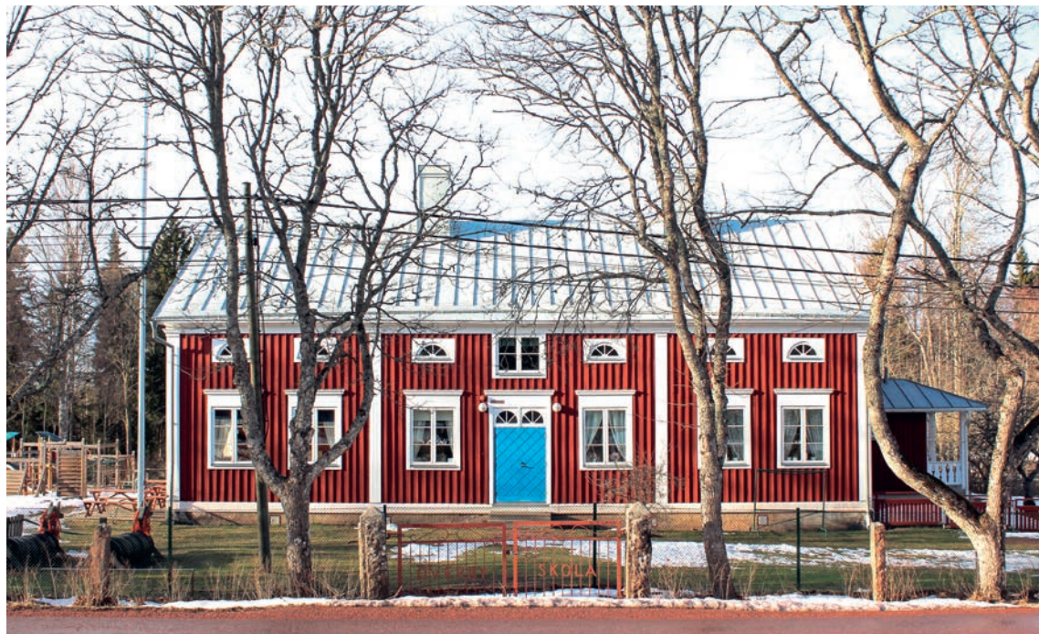
Överby folkskola i Jomala: Foto: Johan Häggblom.