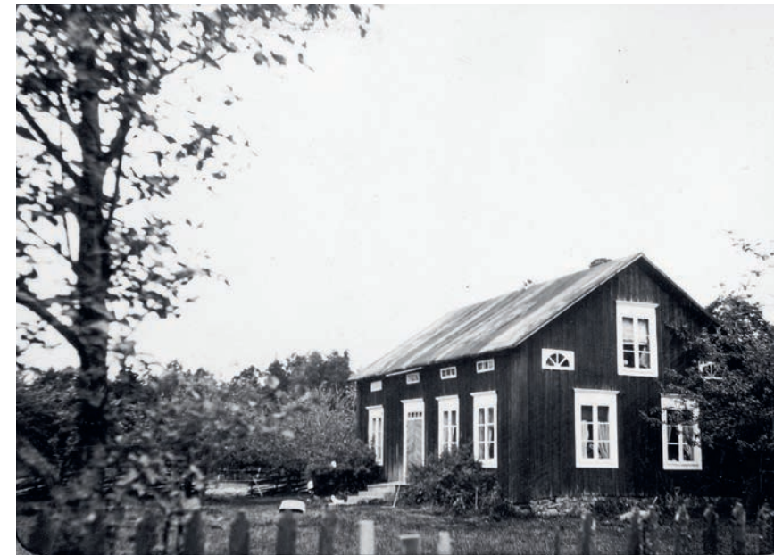
”Villes” i Björnsby, Jomala. Flera byggnader i denna stil har fångat Rudskogs intresse under inventeringen 1923–1924.

vad de sett, något som Rudskog menade var helt främmande i det åländska landskapet. 12 Mest upprörd var han över glasverandorna som han menade vanpryde de gamla husen. De var inte bara främmande tillägg på husen utan de utfördes även i ”anskrämliga former”. De hade opraktiska takformer, avtagna hörn, illa valda färgsättningar samt fönster med tillkrånglad spröjsättning.