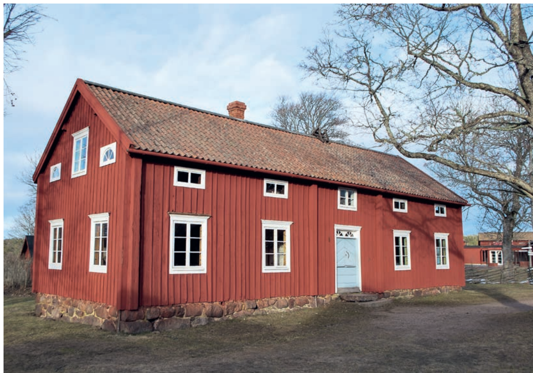
Jan Karlsgårdens mangårdsbyggnad.

Finström, Hammarland och Eckerö. 7 Han hade även denna gång sällskap av Verner Eker under färden. Med från Sverige följde också magister och folkskollärare Sven Kjersén. Alla tre var utrustade med kamera och de dokumenterade allt vad de såg av värde. Ibland fick de skjuts, men i huvudsak använde de cykel eller fötterna för att ta sig runt. Längre sträckor färdades de med motorbåt. 8