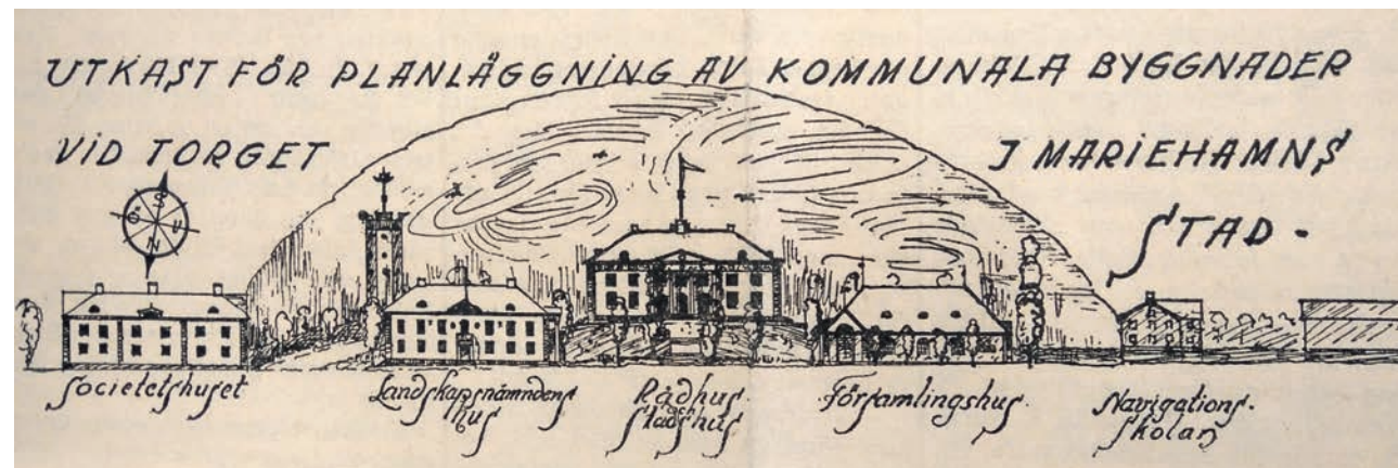
Förslag till omgestaltning av torget. Faksimil ur Tidningen Åland den 11 december 1929.