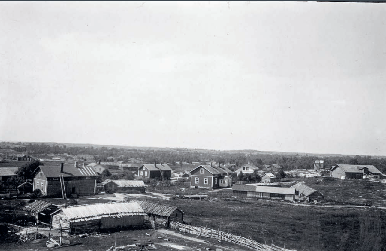
Utsikt över Lappo by, Brändö.