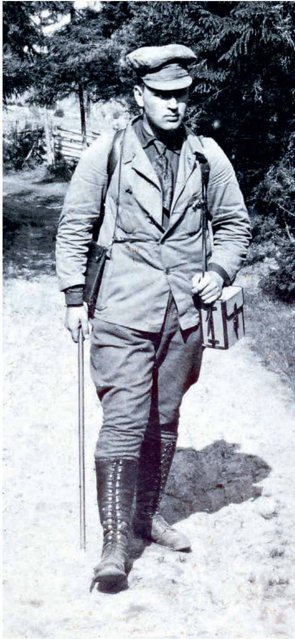
Rudskog fångad på bild i Godby. Troligen tagen i samband med inventering 1924.