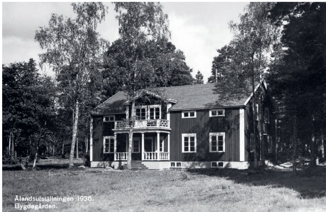
Ålandsgården 1936. Vykort ur Ålands museums arkiv.