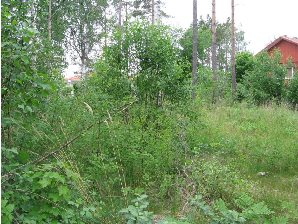
Planområdet sett mot det norra våningshuset till höger i bild.