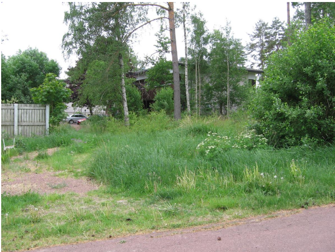
Planområdets östra del sett från Alvägen mot sydväst. Det södra våningshuset, utanför planområdet, och tillhörande parkering syns bakom träden.