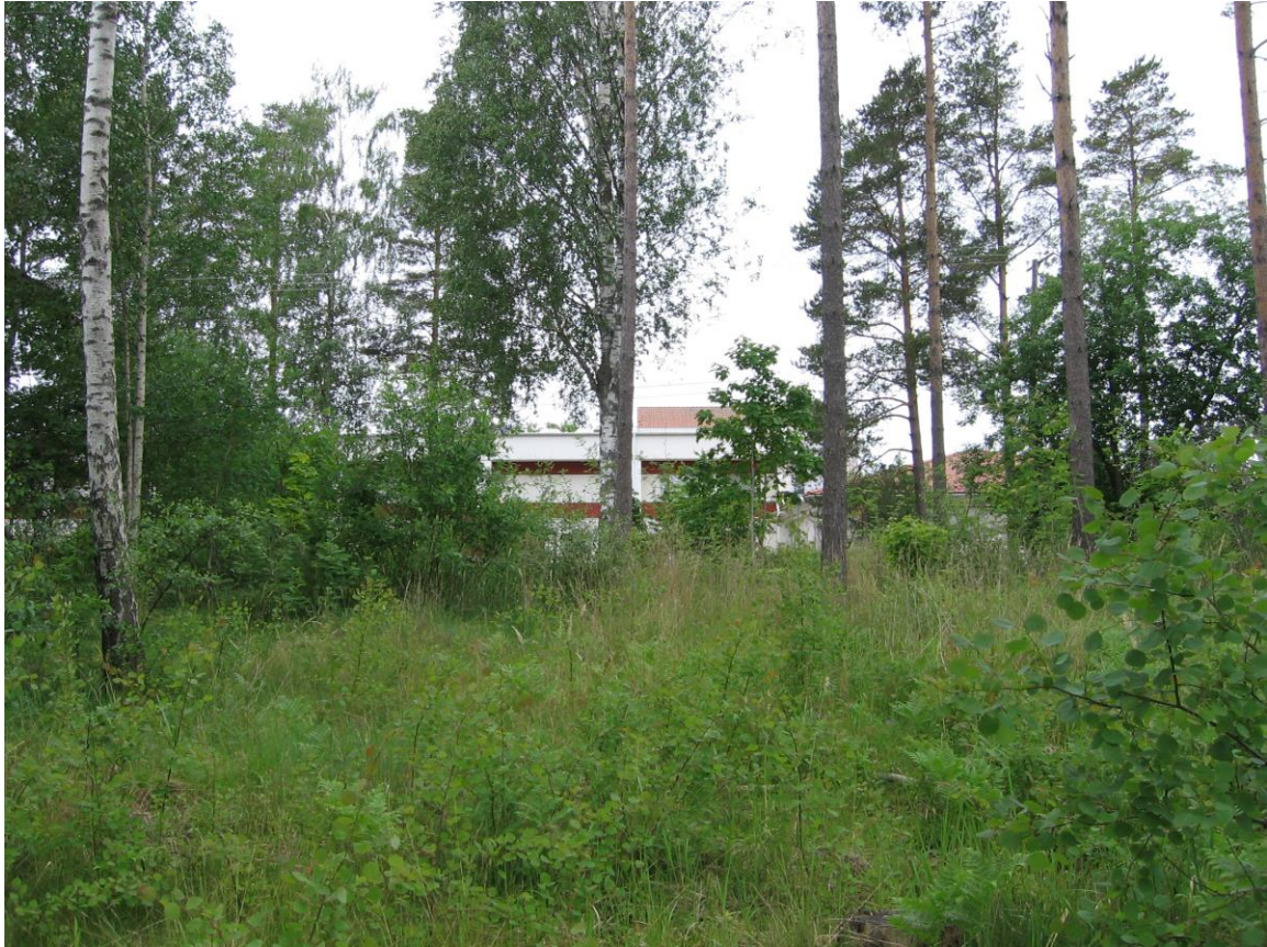
Planområdets västra del. Kyrkby högstadieskolas lokaler i bakgrunden.