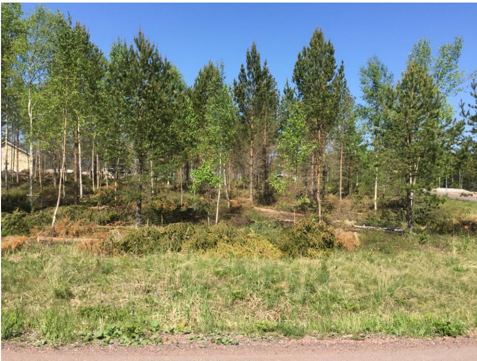
Foto 2 Foto över planområdet, vy söderifrån.