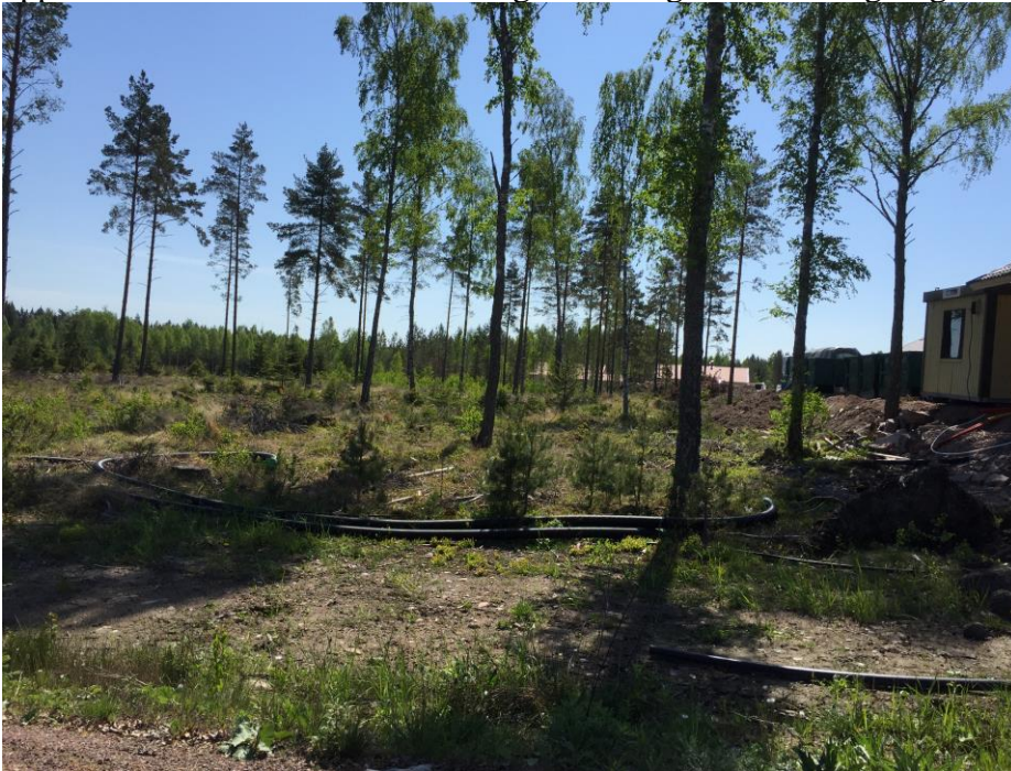
Foto 1 Foto över planområdet, vy norrifrån.

Området gränsar i norr, öster och söder till tomter för egnahemsbebyggelse. På flera tomter uppförs bostadshus. Mot väster gränsar området till tomt 1 och 3 i kvarter 42021, på tomterna uppförs radhus. Kvarter 42021 är avgränsat av gatorna Utskogsvägen och Norrgårdsvägen.